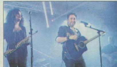
Quand sa musique est bonne...

double jeu.» Pour quelles manifestations peut-on vous contacter ? Nous animons : mariages, repas d'associations, soirées privées, dîners-spectacle, bals et fêtes de villages, thés dansants et repas des aînés. Contactez-nous pour une prestation personnalisée. Nous nous adaptons à toutes