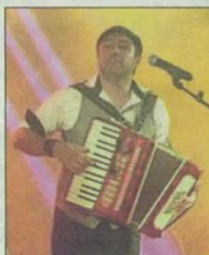
Spectacle Bruel : "Et si ce soir"

« À l'origine, Recto Verso était un duo d'animations musicales, avec le temps, je me suis amélioré et j'ai agrandi mon équipe, ensemble, nous avons créé des spectacles à thème. Depuis 2013, nous nous sommes spécialisés dans le spectacle "tribute".