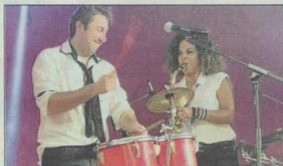
Orchestre "Double Jeu" et "Sweet Mélodie"

« "Tribute" est un spectacle avec un sosie qui chante. Par exemple : le sosie de Goldman s'appuie dans nos spectacles sur ses chansons. Tout a débuté avec le spectacle de Goldman, dont je suis fan et totalement influencé musicalement. Forts de ce succès et de